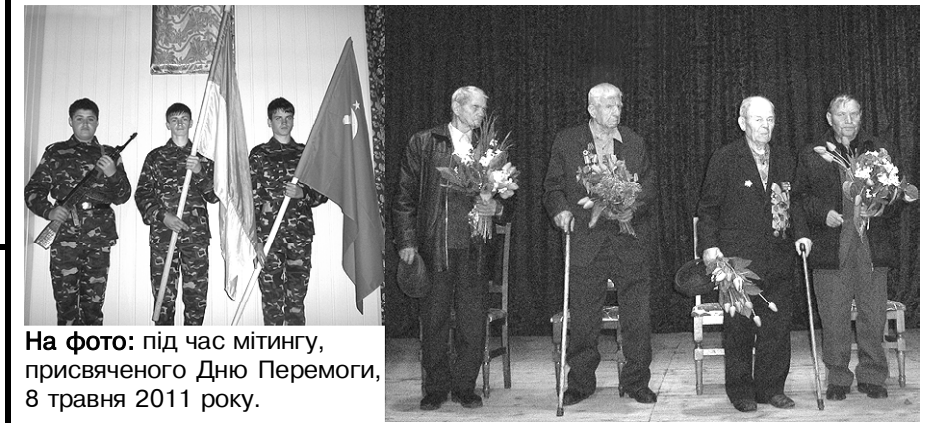
На фото: під час мітингу, присвяченого Дню Перемоги, 8 травня 2011 року.

Ближче до ночі небо прояснилось і святкова дискотека відбулася на подвір'ї БК.