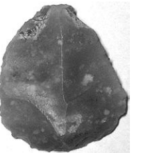
Фото в натуральну величину.

дену у нас, то висновок напрашується такий: на цій території вже дуже давно живуть люди і земля зберігає багато слідів. Треба лише їх побачити.