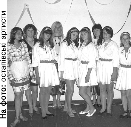
На фото: Остапівські артисти