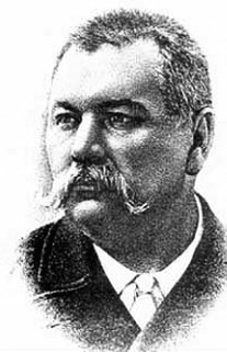
Марко Лукич Кропивницький 22/V-1840 21/IV-1910

Цієї весни виповнилось 170 років від дня народження Марка Лукича та 100 років від дня його смерті.